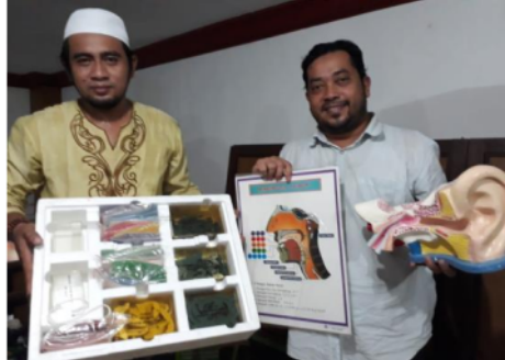
Gambar 3. Produk Mitra Alat Peraga Pendidikan

dapat menjamin keakuratan informasi yang terjadi dalam laoran harga pokok produksi (Komara & Sudarma, 2016; Kondoy et al., 2015). Metode full costing bersifat jangka panjang dan informasi perhitungan harga pokok produksi lebih banyak digunakan untuk kepentingan luar perusahaan.