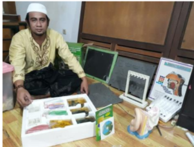
Gambar 2. Ruang Worksop Produk Mitra

Berdasarkan Tabel 2 harga pokok produksi dengan menggunakan metode UKM mitra yaitu sebesar Rp. 28.000/unit dan apabila ditambah dengan laba yang diinginkan sebanyak 150% maka harga jual menurut UKM barokah adalah sebesar Rp. 42.000/unit.