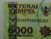
(Reiza Respati Fardiansyah)