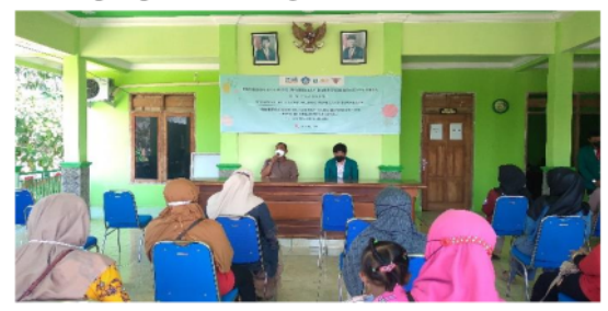
Gambar 2. Sambutan Bapak Kepala Desa

menjahit dilanjutkan dengan implementasinya. Penyampaian teori berkaitan dengan bahan dasar pembuatan totebag dan jilbab, penggolongan peralatan menjahit, mengidentifikasi alat potong untuk menggunting bahan dasar, membedakan tanda-tanda pola setelah bahan digunting dan cara penggunaan alat pemberi tanda serta pemindahan tanda-tanda pola. Penyampaian teori juga berkaitan dengan penetapan harga jual produk berdasarkan biaya produksinya dan tingkat keuntungan yang diinginkan sampai pada rancangan label beserta kemasan produk.