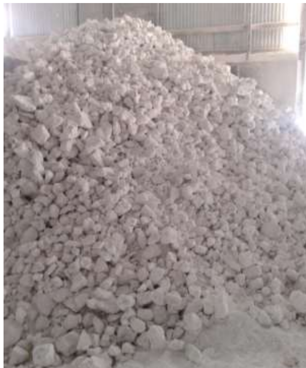
Produk Jadi – Gamping