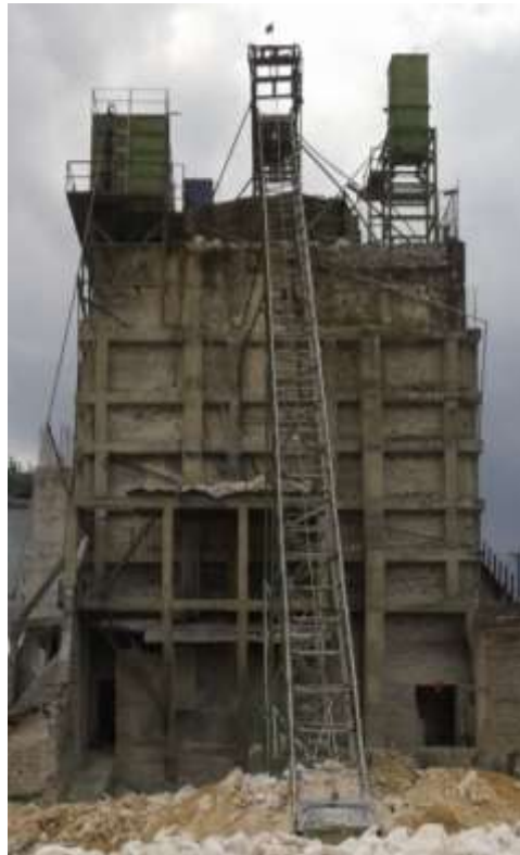
Gambar 4 Lubang Keluar Produk Jadi