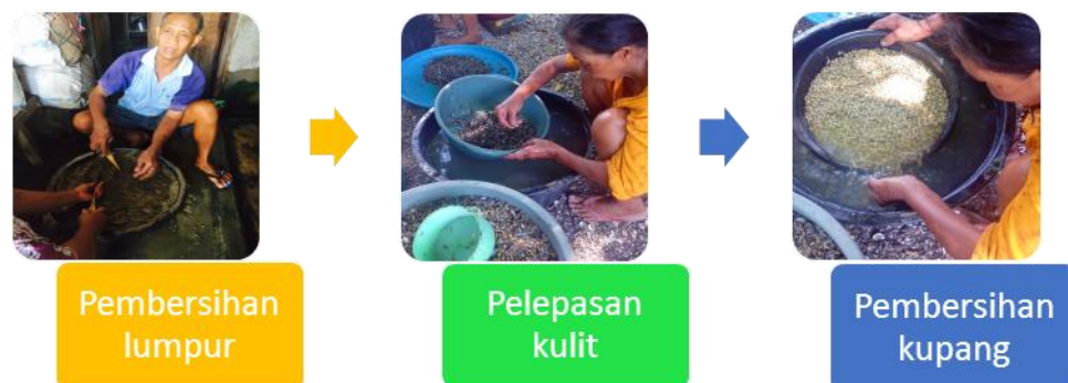
Gambar 2. Tahap Pengolahan Kupang

Kegiatan kunjungan ke tempat penangkapan dan pengolahan kupang dilakukan oleh tim di daerah pantai kenjeran Surabaya. Informasi yang diperoleh dari Ibu Marsiya sebagai nelayan penangkap kupang sekaligus membersihkan hingga mengolah kupang sendiri menjadi kerupuk kupang. Adapun tahapan atau proses pengolahan kupang disajikan berikut ini :