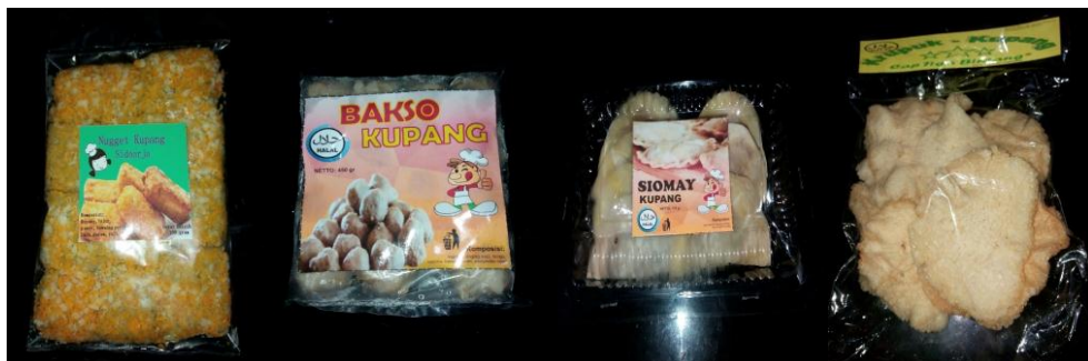
Gambar 7. Hasil Diversifikasi Olahan Kupang

Pendampingan kepada mitra pengabdian masyarakat, dalam hal ini ketiga orang ibu PKK yang telah melakukan produksi olahan kupang juga dilakukan untuk pengemasan produk. Bantuan berupa alat pemotong adonan krupuk, sealer manual, maupun sealer vacuum diberikan kepada masing-masing orang tersebut. Tim juga telah mendesainkan kemasan produk untuk krupuk kupang, nugget kupang, dan bakso/siomay kupang. Berikut hasil produk yang sudah dikemas: