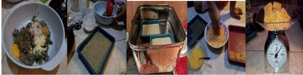
Gambar 6. Proses Pembuatan Nugget Kupang

bakso/siomay kupang. Berikut salah satu pendampingan proses pembuatan nugget kupang: