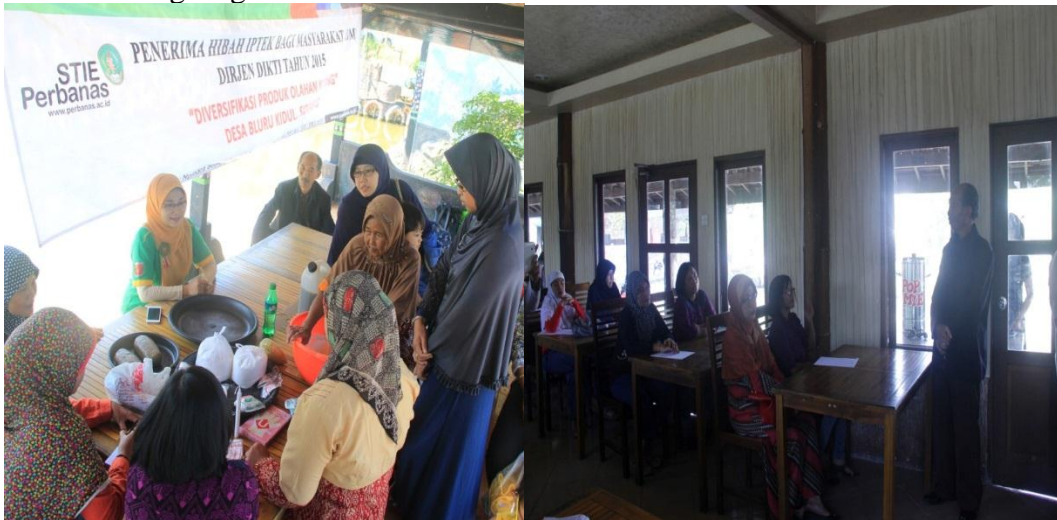
Gambar 4 dan 5. Pelatihan Kewirausahaan dan Workshop Pengolahan Kerupuk Kupang

Pentingnya memupuk jiwa kewirausahaan dilakukan untuk membentuk minat para ibu-ibu PKK dalam menciptakan lapangan pekerjaan sendiri di rumah. Narasumber didatangkan dari Bidang Ekonomi dan Sumberdaya Alam BAPPEDA dan pengusaha muda dari UD. Rajabon. Dari pelatihan kewirausahaan ini diharapkan ibu-ibu dapat mengetahui apa saja yang harus dipersiapkan untuk memulai usaha, cara mengemas produk menjadi lebih menarik, cara memasarkan produk, sampai dengan mempertahankan kelangsungan usaha.