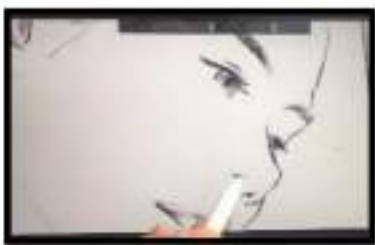
Figure 2. Sketsa Digital

Berdasarkan pada deskripsi karya ilustrasi diatas, digunakan subject matter berwujud wanita yang tanpa menggunakan pakaian sebagai wujud dari penggambaran aktifitas dalam bentuk seni pertunjukkan yang di bawakan atau di pentaskan oleh Marina Abramovic sebagai bentuk gerakan yang memberikan perwakilan dari bentuk objektifikasi tubuh wanita.