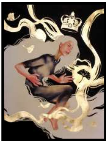
Figure 8. Hasil Akhir

Simbol pewaranaan diatas merupakan simbol bentuk ketertarikan terhadap duniawi, kemudian ditambahkan bentuk mahkota raja yang memiliki sebuah arti bahwa orang ingin menguasai segala sesuatu menjadi raja, namun tidak akan pernah bisa menempelkan atau menempatkan mahkota kepala, karena semuanya itu adalah sebuah istilah beberapa daun-daun yang terlepas ini ini menggambarkan sebetulnya sebuah hal yang selalu diberikan tidak akan terlihat sehingga, dalam kehidupannya tidak akan pernah tercukupi. Dan juga juga dalam pandangannya akan selalu melihat sesuatu capaian yang besar.