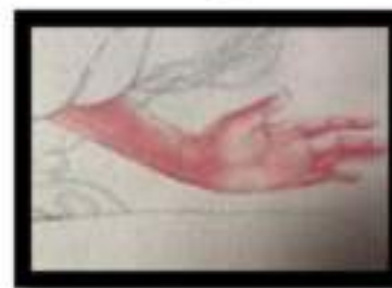
Figure 4. Pewarnaan Tangan

Pada gambar sketsa digital digambarkan dengan ingin menunjukkan proses pembuatan awal. Sketsanya lebih detail terdiri digital, hal ini dikaukan untuk mengetahui proporsinya supaya ketika ditempatkan pada objek-objek lain komposisinya ditempatkan pada media digital sehingga ketika mampu diselesaikan sesuai dengan penempatan pada media dan kemudian dipindahkan ke kertas.