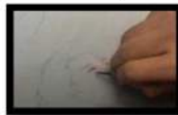
Figure 3. Pewarnaan Area Kepala

Dengan membuat pose wanita yang berusaha untuk menggapai sebuah daun ginkgo yang kosong, namun dari kekosongan itu berkilau emas. Daun ginkgo dalam mitos Jepang merupakan perlambangan dari ketahanan dan keabadian. Mahkota raja diposisikan diatas kepala wanita, yang merupakan ilustrasi dari kemuliaan yang tidak akan pernah tercapai.