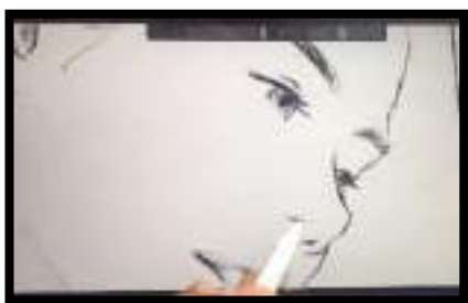
Figure 2. Sketsa Digital

Berdasarkan pada deskripsi karya ilustrasi diatas, digunakan subject matter berwujud wanita yang tanpa menggunakan pakaian sebagai wujud dari penggambaran aktifitas dalam bentuk seni pertunjukkan yang di bawakan atau di pentaskan oleh Marina Abramovic sebagai bentuk gerakan yang memberikan perwakilan dari bentuk objektifikasi tubuh wanita.