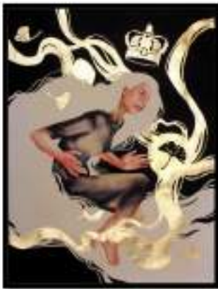
Figure 8. Hasil Akhir

Simbol pewarnaan diatas merupakan simbol bentuk ketertarikan terhadap duniawi, kemudian ditambahkan bentuk mahkota raja yang memiliki sebuah arti bahwa orang ingin menguasai segala sesuatu menjadi raja, namun tidak akan pernah bisa menempelkan atau menempatkan mahkota kepala, karena semuanya itu adalah sebuah istilah beberapa daun-daun yang terlepas ini ini menggambarkan sebetulnya sebuah hal yang selalu diberikan tidak akan terlihat sehingga, dalam kehidupannya tidak akan pernah tercukupi. Dan juga juga dalam pandangannya akan selalu melihat sesuatu capaian yang besar.