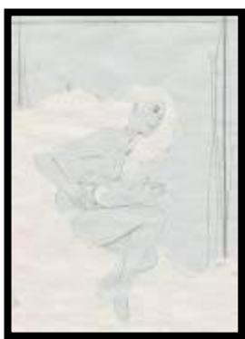
Figure. 1 Sketsa Awal

Penonton yang benar-benar menggunakan dan mengobjektifkan tubuh Abramović mencontohkan konotasi feminis dari pertunjukan tersebut. Saat melihat karya pertunjukan terkenal ini, kita dapat belajar tentang pentingnya karya feminis, kemungkinan bahaya dari dinamika kelompok yang berbahaya, dan tanggung jawab etis kompleks yang kita miliki untuk orang lain di sekitar kita. Ruang seni berfokus pada performing arts mulai bermunculan dipusat-pusat seni internasional, pada festival di museum, di Universitas dengan disiplin ilmu seni dan desain yang mengajarkan performing arts dan di majalah-majalah seni (Goldberg, 2014; Pristiati, 2018). Performing arts didefinisikan sebagai praktik seni berupa suatu aksi yang dikonsepsikan oleh seniman/performer, dimana kehadiran tubuh dalam ruang dan waktu tertentu menjadi medium utama dalam mengekspresikan suatu peristiwa.