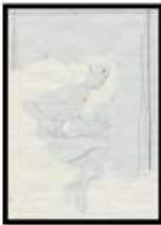
Figure 1. Sketsa Awal

Penonton yang benar-benar menggunakan dan mengobjektifkan tubuh Abramović mencontohkan konotasi feminis dari pertunjukan tersebut. Saat melihat karya pertunjukan terkenal ini, kita dapat belajar tentang pentingnya karya feminis, kemungkinan bahaya dari dinamika kelompok yang berbahaya, dan tanggung jawab kompleks yang kita miliki untuk orang lain di sekitar kita. Ruang seni berfokus pada performing arts mulai bermunculan dipusat-pusat seni internasional, pada festival di museum, di Universitas dengan disiplin ilmu seni dan desain yang mengajarkan performing arts dan di majalah-majalah seni (Goldberg, 2014; Pristiati, 2018). Performing arts didefinisikan sebagai praktik seni berupa suatu aksi yang dikonsepsikan oleh seniman/performer, dimana kehadiran tubuh dalam ruang dan waktu tertentu menjadi medium utama dalam mengekspresikan suatu peristiwa.