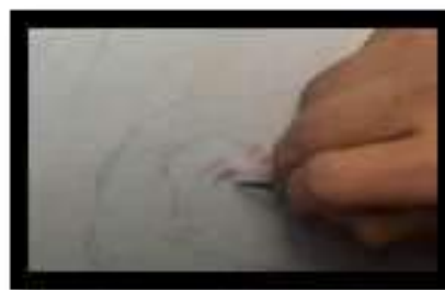
Figure 3. Pewarnaan Area Kepala

Dengan membuat pose wanita yang berusaha untuk menggapai sebuah dan ginkgo yang kosong, namun dari kekosongan itu berkilau emas. Daun ginkgo dalam mitos Jepang merupakan perlambangan dari ketahanan dan keabadian. Mahkota raja diposisikan diatas kepala wanita, yang merupakan ilustrasi dari kemuliaan yang tidak akan pernah tercapai.