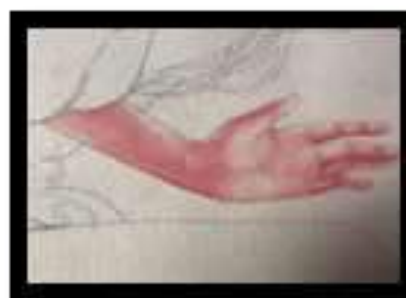
Figure 4. Pewarnaan Tangan

Pada gambar sketsa digital digambarkan dengan ingin menunjukkan proses pembuatan awal. Sketsanya lebih detail terdiri digital, hal ini dilakukan untuk mengetahui proporsinya supaya ketika ditempatkan pada objek-objek lain komposisinya ditempatkan pada media digital sehingga ketika mampu diselesaikan sesuai dengan penempatan pada media dan kemudian dipindahkan ke kertas.