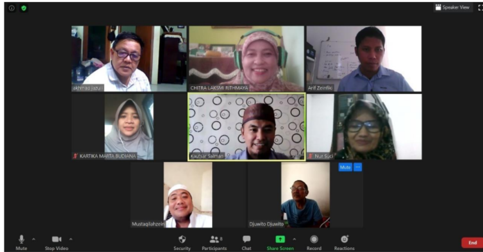
Gambar 2. Pelatihan Online Aplikasi SIWAK dengan Mitra